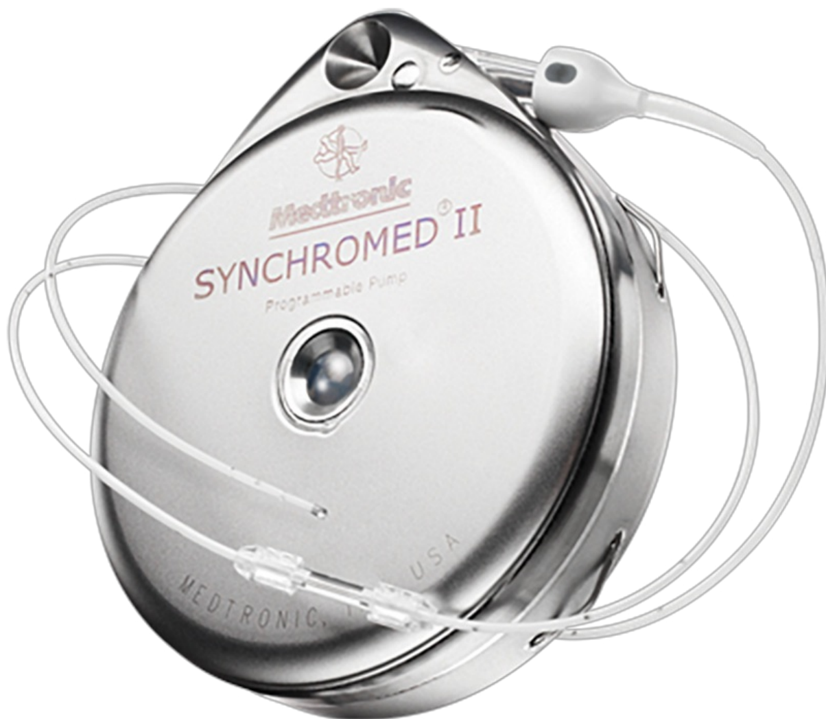
FIGUR 2 Morfinpumpen. Illustrationen bringes med tilladelse fra firmaet.

Flowhastigheden ændrer sig ift. kropstemperaturen, så den øges ved temperatur over 37 °C og falder ved temperatur under 37 °C.