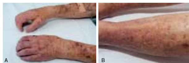
Figur 1. Nefrogen fibroserende dermatopati/nefrogen systemisk fibrose. A. Forandringer i huden og kontrakturer af fingerleddene. B. Hyperpigmenteret hud med nopret, »brostenslignende« overflade på skinnebenene.

Nefrogen fibroserende dermatopati/nefrogen systemisk fibrose udvikledes hos en 60-årig mand i kronisk dialysebehandling. Siden 1971 er patienten blevet nyretransplanteret tre gange. Behandlingen omfatter nu natlig hjemmedialyse fem gange ugentligt. I 2005 fik han foretaget en MR-angiografi af en femero-femoral karprotese med gadodiamid som kontraststof. I de efterfølgende måneder udvikledes symmetrisk fortykkelse, hårdhed og stivhed af huden på de distale dele af ekstremiteterne, og senere strækkedefekt over flere led.