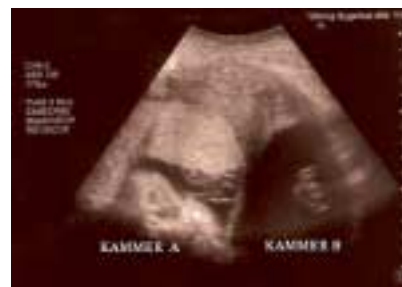
Figur 1. Graviditeten i uge 30 + 6 (kammer A), fostervandslomme med navlesnoren (kammer B).

To intrauterine graviditeter forekom hos samme patient, der var behandlet med transcervikal endometriresektion pga. blødningsforstyrrelse. Den ene graviditet endte med en spontan abort i uge 9+5, den anden endte efter at have været kompliceret med fødsel af et rask barn i uge 34+3. Sygehistorien gennemgås.