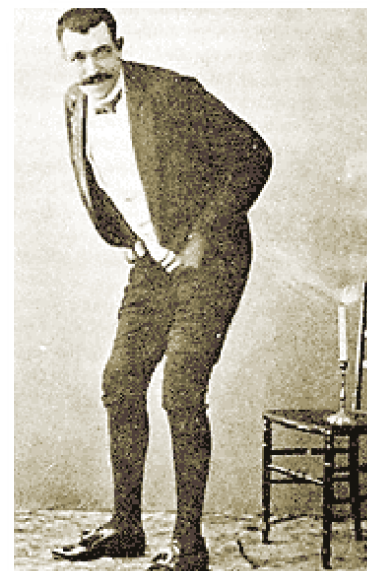
Figur 2. Joseph Pujol . Som udtryk for den styrke hvormed han kunne intonere, blæser flatufonisten her et stearinlys ud, der er anbragt 30 cm bag ham. Dette gentog han i overværelse af en række læger i det fysiologiske laboratorium på l'Ecole pratique de la Faculté de médecine i Paris.