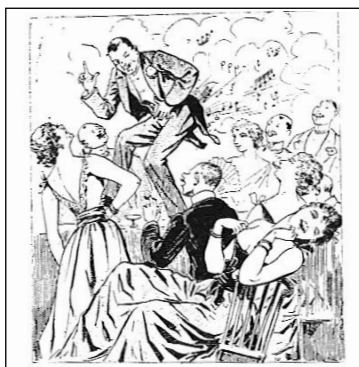
Figur 3. Tegning fra Paris qui rit , 6. oktober 1892, der viser den hæmningsløse begejstring, som Pujols optræden på Moulin Rouge udløser.

ribben og dermed øge abdominalkavitets rumfang. Hermed nedsættes det intraabdominale tryk, så luft kan passere ind i rektum, med andre ord en simpel mekanisk forklaring. Poirier erkender dog, at der hos Pujol må være en »prédisposition anatomique«.