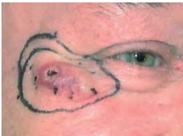
Figur 1. Recidiv af primært mucinøst karcinom.