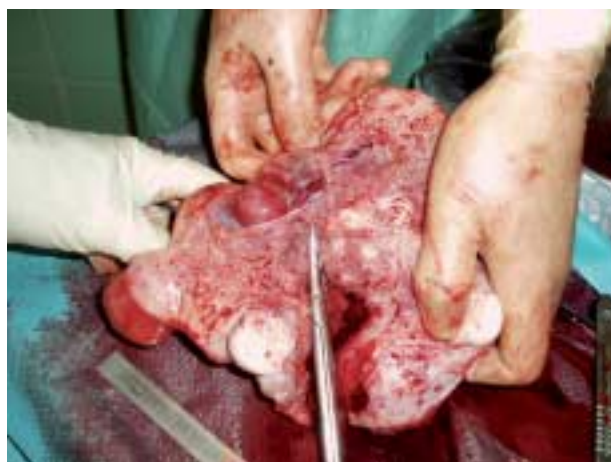
Figur 1. Hysterektomiopræparat: en uterus med talrige store fibromer og et foster i 12. uge (graviditet efter endometriresektion).

Transcervikal resektion af endometriet er et alternativ til hysterektomi i behandlingen af menoragi. Indgrebet er irreversibelt og bør kun udføres, hvis der ikke er ønske om fremtidig graviditet, da det er forbundet med øget risiko. Vi bringer tre sygehistorier om graviditet hos to patienter, der havde fået foretaget endometriresektion. Alle ikkesteriliserede kvinder bør informeres om vigtigheden af brug af prævention efter indgrebet. Såfremt en graviditet konstateres, bør der informeres om den betydelige risiko for graviditetskomplikationer. Såfremt kvinden ønsker at fortsætte graviditeten, bør hun følges tæt i graviditeten.