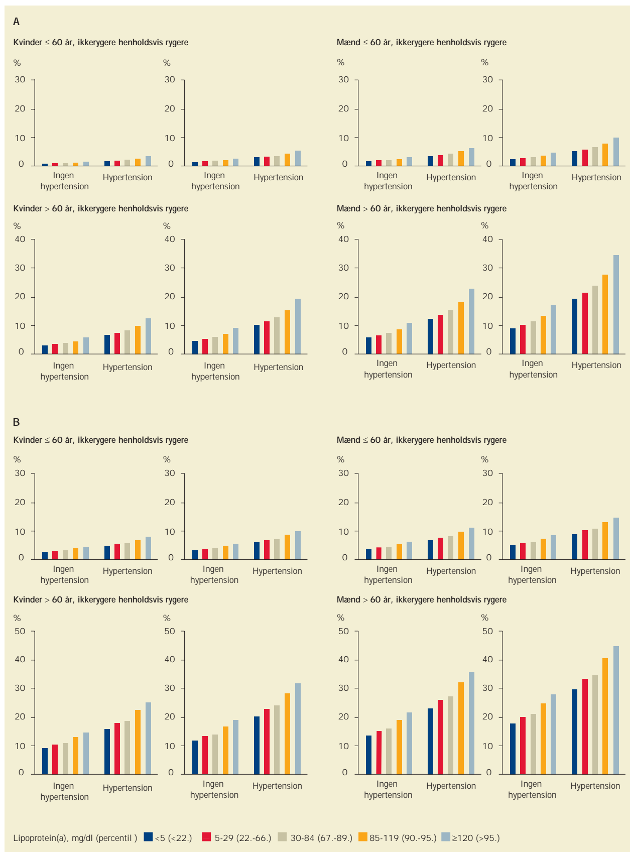
Figur 2. Absolut 10-års-risiko for myokardieinfarkt (A) og iskæmisk hjertesygdom (B) i % som funktion af lipoprotein(a)-niveau, køn, rygning (nej/ja), hypertension (nej/ja) og alder. Kilde: [22].