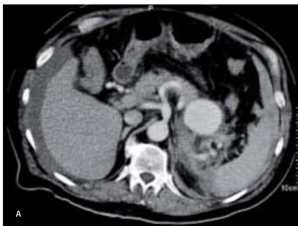
Figur 1A. Aneurisme på arteria lienalis vist ved computertomografi.

Arteria lienalis-aneurismer (ALA) er traditionelt blevet behandlet med operation, men endovaskulære teknikker vinder i stigende grad frem. En 64-årig mand med brystmerter og lavt blodtryk blev indlagt på et centralsygehus. Der var mistanke om akut myokardieinfarkt. En computertomografi viste et 56-mm aneurisme på a. lienalis og tegn på ruptur. Man valgte derfor at overflytte patienten til et universitetssygehus for at coile aneurismet ved endovaskulær teknik. Blodtryk og hæmoglobinværdierne stabiliseredes, og patienten blev udskrevet i velbefindende. I tilfælde af ruptureret ALA virker endovaskulær teknik som det rigtige valg.