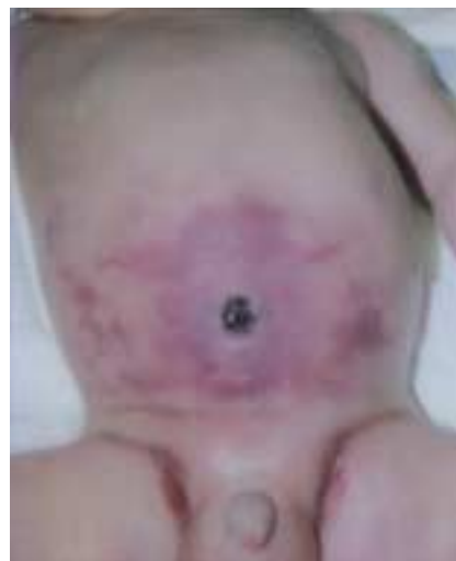
Figur 1. Omfalitis hos en fire dage gammel dreng.

Omfalitis er en alvorlig sygdom med høj morbiditet og mortalitet, især i udviklingslande. De oftest forekommende mikroorganismer er Staphylococcus aureus , Escherichia coli , Klebsiella pneumoniae og Pseudomonas aeruginosa . Vi beskriver en dansk patient med cellulitis, alvorlig sepsis og vena portatrombose som fatale komplikationer i forbindelse med omfalitis. På trods af tidlig erkendelse og behandling lykkedes det ikke at redde barnet.