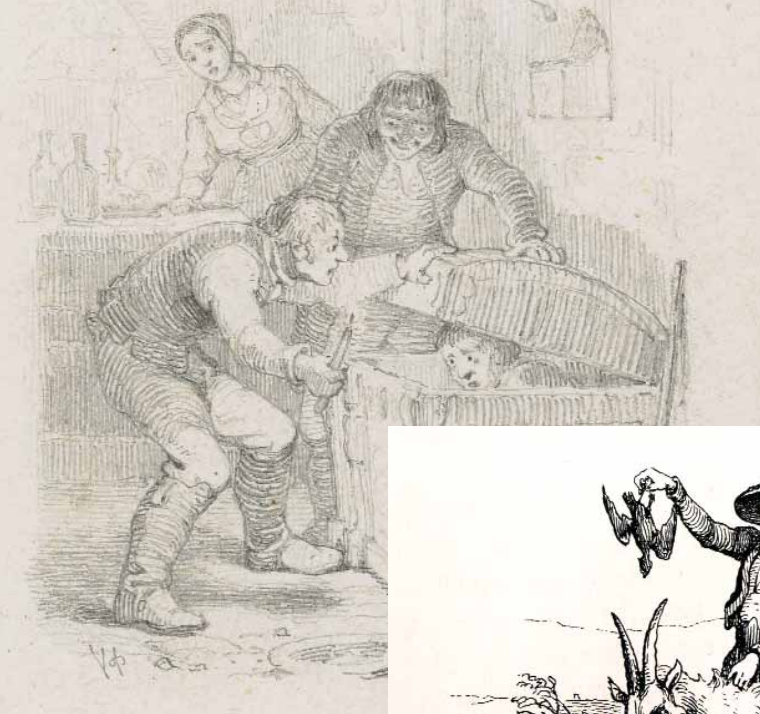
Degnen fra Nr. Broby. (Illustration: Odense Bys Museer).