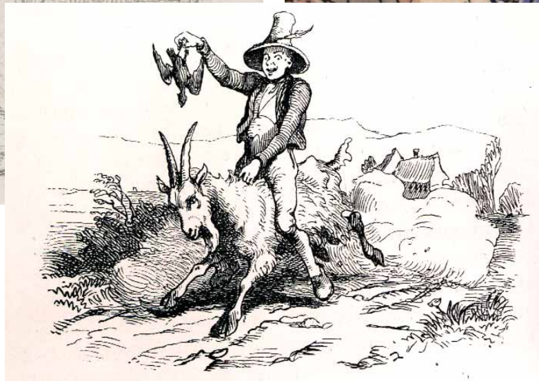
Oldermanden fra Bogense.