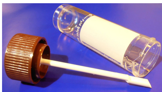
Koncentrationen af calprotectin kan måles i en almindelig afføringsprøve.

Ved IBD er det vigtigt løbende at afgøre, om der er sygdomsaktivitet, og vurdere sværhedsgraden for at kunne justere den medicinske behandling. FC-koncentrationen er forhøjet ved aktiv sygdom og korrelerer til både endoskopisk og histologisk sygdomsaktivitet [12, 13], hvor man har fundet en skæringsværdi på 250 mg/kg for aktiv endoskopisk sygdom ved colitis ulcerosa og en tilsvarende værdi for tilstedeværelsen af store ulcera ved Crohns sygdom [13]. Hos mange patienter normaliseres FC-koncentrationen under den medicinske behandling, i takt med at inflammationen aftager [14], og måling af FC-koncentration kan derfor være af særlig værdi ved konsekutive målinger under behandlingen. FC-koncentration