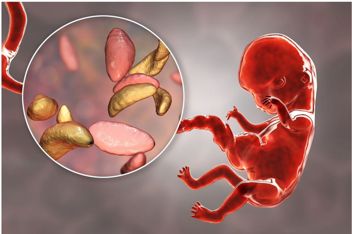
Transplacental smitte af foster med Toxoplasma gondii .

Human smitte med T.gondii kan ske fækalt-oralt via fødevarer, herunder kontaminerede rå grøntsager eller ikkegennemstegt kød fra inficerede dyr [2, 12]. Smitte fra menneske til menneske sker transplacentalt fra mor til foster, men er også muligt ved blodtransfusion/organtransplantation [1, 2].