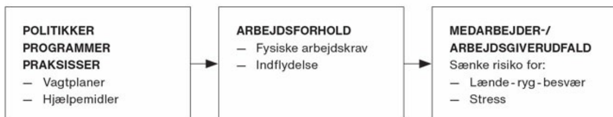
FIGUR 1 Sammenhæng mellem organisationens politikker, programmer og praksisser, arbejdsforhold og medarbejderudfald (f.eks. ulykker, depression og rygsmerter).

TWH er mere end en integration af forebyggelse og sundhedsfremme. Det er et forsøg på i organisationen at etablere en sundhedskultur, som påvirker organisationens måde at udforme arbejdet på. Dette gøres ved at: 1) sikre et stærkt ledelsesengagement hvor sikkerhed, sundhed og trivsel er en prioritet i hele organisationen, 2) etablere aktiv medarbejderdeltagelse (participatoriske processer), hvor ansatte fra alle organisationsniveauer (individ, gruppe, ledelse og organisationen (IGLO)) deltager i planlægningen og udførelsen af initiativer til beskyttelse og fremme af sikkerhed og sundhed på arbejdspladsen, 3) politikker, programmer og praksisser i organisationen understøtter positive arbejdsforhold, og 4) der arbejdes med datadreven forandring, hvor regelmæssige målinger guider løbende forbedringsarbejde af sundhedsfremmende initiativer.